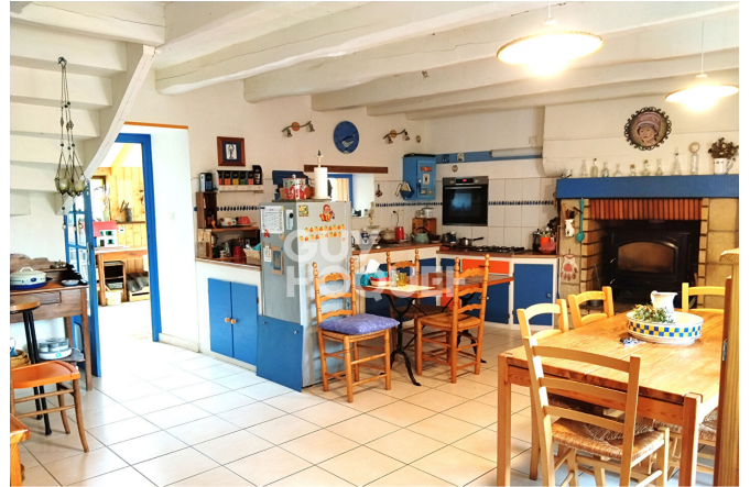
Contactez GUY HOQUET LANVALLAY au 02-79-76-87-86