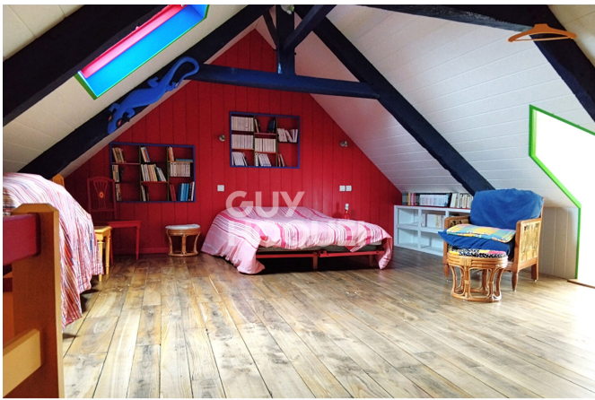
Contactez GUY HOQUET LANVALLAY au 02-79-76-87-86